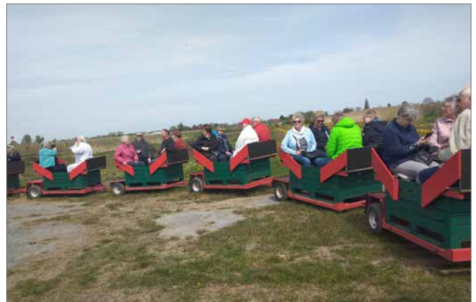
In Jork stiegen die SoVD-Mitglieder vom Bus in den Obsthof-Express um.

Im hofeigenen Café gab es vor der Rückfahrt Kaffee und Kuchen und in Grünhagen, wiederum nach einer Überlandfahrt, beim Italiener eine warme Mahlzeit, Schnitzel mit Pilzen und speziell italienisch zubereiteten Kartoffelstückchen.