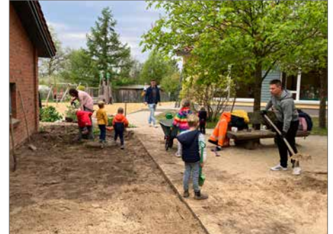
Alle packen fleißig mit an.

Bienenbüttel. Es wird gemalert, gefegt, Unkraut gejätet, umgepflanzt, Platten neu verlegt – in jeder Ecke wird auf dem Außengelände der DRK-Kindertagesstätte Bienenbüttel gearbeitet. Ein Gartenhäuschen in einem verwischten Gelb, erstrahlt in neuer frischer Farbe, denn eine Elterntuppe hat sich mit Pinsel und Farbe bewaffnet. Natürlich haben auch die Kinder fleißig beim Streichen mitgeholfen. In einer anderen Ecke haben Eltern und Kinder die blaue Farbe genommen, um aus verblasstem Blau ein frisches Blau zu machen. Auf der anderen Seite des blauen Abstellhäuschens sind Gehwegplatten verlegt und werden mit einem Rüttler fest in den Boden gerüttelt. Es ist laut, aber das stört niemanden, denn jeder weiß, warum und wofür es diesen Krach gibt.