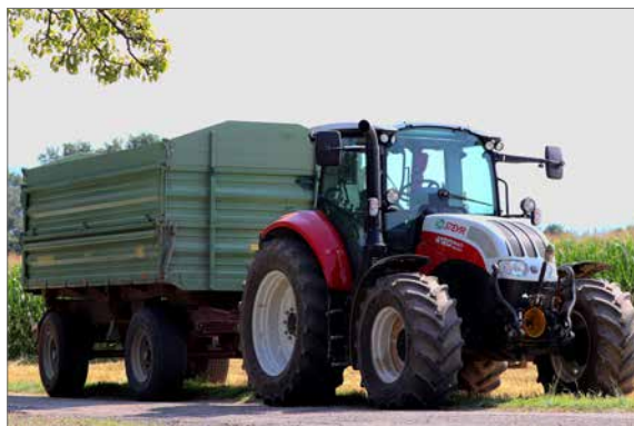
Die Gemeinde plädiert für ein respektvolles Miteinander auf den Wegen.

Durch umsichtiges Verhalten können hier Kosten gespart werden. Gleichzeitig bittet die Gemeinde Bienenbüttel die Fahrer der großen landwirtschaftlichen Fahrzeuge, in solchen Situationen langsam und umsichtig zu fahren. Es macht einigen Menschen Angst, wenn ein vollbeladener Schlepper mit 30 bis 50 Kilometern pro Stunde auf sie zugefahren kommt. Die Gemeinde bittet daher um gegenseitige Rücksichtnahme, damit durch ein friedliches Miteinander nicht nur die Sicherheit aller Beteiligten, sondern auch der Genuss des Radfahrens und Spazierengehens, aber auch des (Land-)Wirtschaftens noch gesteigert wird.