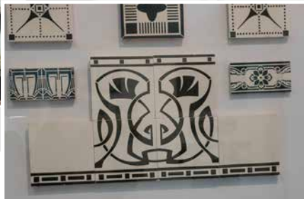
Die Ausstellung im Fliesenmuseum zeigt unter anderem Motive des Jugendstils.