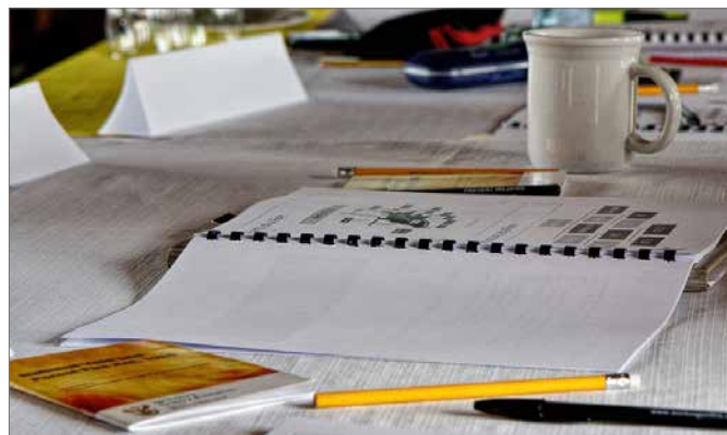
Die Planung rund um das Mehrzweckzentrum läuft.

Nachdem die Unternehmen ihre Entwürfe überarbeitet haben, werden sie diese im Frühsommer erneut den Gremien präsentieren, die dann wiederum im Hochsommer darüber beraten.