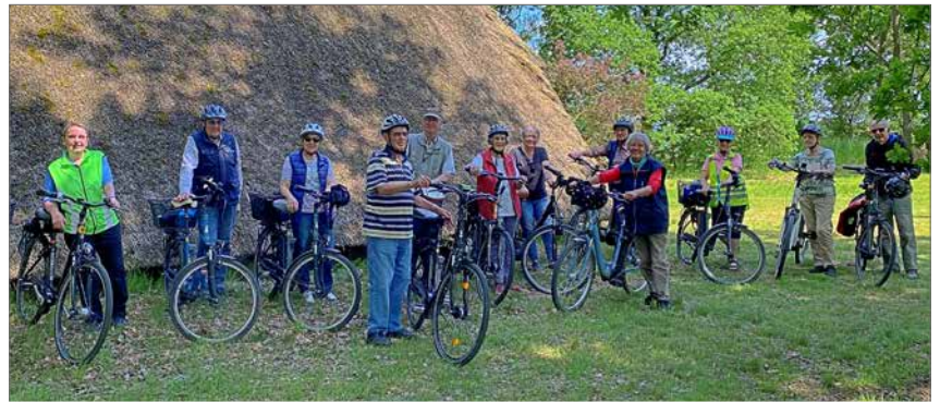
Die Wandergruppe ist bei bestem Wetter mit dem Fahrrad unterwegs.

Am Pfingstsonntag fanden sich bei bestem (Rad-)Wanderwetter 13 Wanderfreunde am Treffpunkt ein, um sich gemeinsam auf die angekündigte, etwa 25 Kilometer lange Radtour zu begeben. Da aufgrund vieler Straßenbauaktivitäten derzeit auf nahezu allen Zubringerstraßen von und nach Bienenbüttel relativ starker Autoverkehr herrscht, sollte die Route weitestgehend über gut mit dem Rad befahrbare Verbindungswege mit wenig Fahrzeugverkehr durch die Wald- und Feldmark verlaufen. So fuhren wir vom Startpunkt aus am Bienenbütteler Mühlenteich entlang zum Sandweg und dann weiter über den Georg-Steig zum Wichmannsbürger Schmiedewinkel. Am Lietzberg hielten wir uns in Richtung Hohnstorf und erreichten nach Überquerung des Elbe-Seitenkanals das Gut Solchstorf. Von hier aus wählten wir für die nächste Etappe nach Altenmedingen einen ausgezeichneten Waldweg, der uns zunächst bis Reisenmoor führte. Dadurch konnten wir die gefürchtete „Stoßdämpfer-Teststrecke“ mit ihrem groben Kopfsteinpflaster auf der direkten Verbindung zwischen Solchstorf und Reisenmoor umfahren. Im weiteren Verlauf radelten wir zu den Königsgräbern bei Haaßel, einer jungsteinzeitlichen Anlage von Großsteingräbern aus der Zeit um 3000 v. Chr., wo auch die beigefügten Fotos entstanden. Die zweite Hälfte der