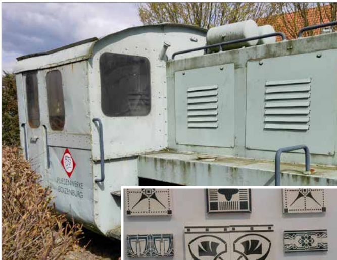
Eine Diesellok vor dem Hotel Stadt Boizenburg.

Freunde und Mitarbeiter der ehemaligen Plattenfabrik eröffnen 1998 ein Museum