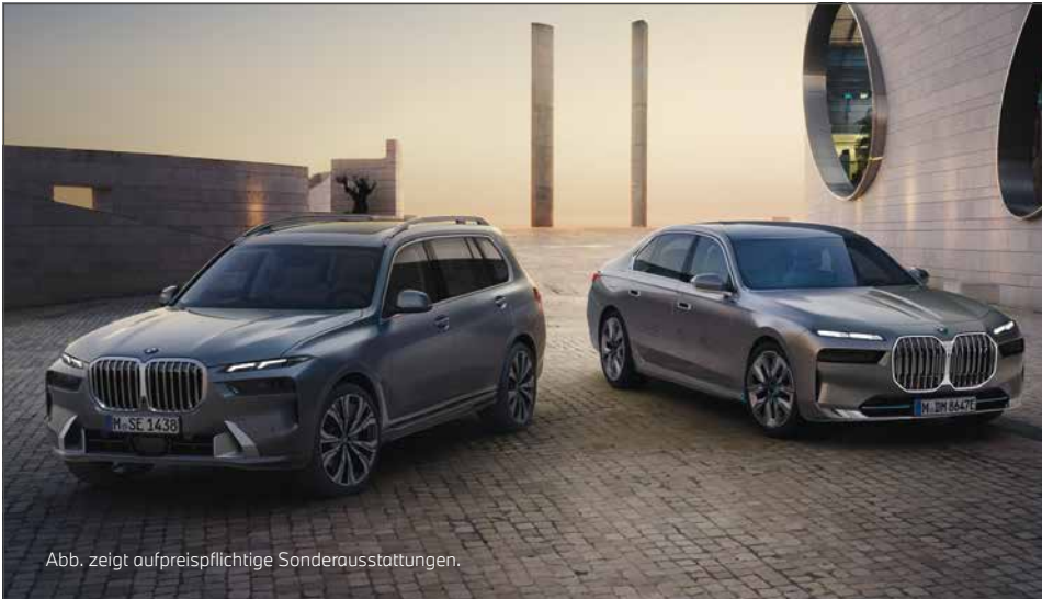
Abb. zeigt aufpreispflichtige Sonderausstattungen.