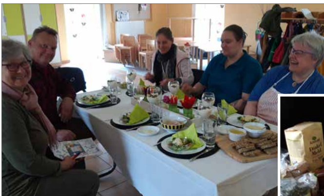
Es wurde erklärt, gekocht und schließlich genossen.

Grünhagen. „Anka's stay young – kitchen“ zum ersten Mal im Dorfgemeinschaftshaus Grünhagen! Mit sechs Teilnehmern hatten wir viel Spaß beim Einführungskurs in die „basenüberschüssige Ernährung“ mit vielen Antioxidantien, die völlig zu Recht als Anti-aging-Ernährung bezeichnet werden darf. Es wurde erklärt, gekocht und genossen; weitere Kurse sind lose geplant (immer auf Spendenbasis!). Der Kurs ist vorrangig für Grünhagener gedacht; Gäste sind aber herzlich willkommen.