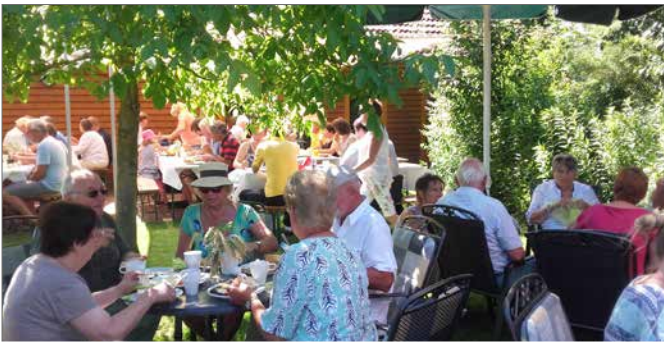
Im vergangenen Jahr war das Frühstück gut besucht.

Frühstück im Grünen mit Familie, Freunden und Nachbarn