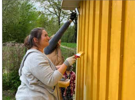
... und Gelb erst recht.