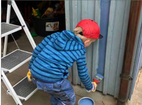
Ein frisches Blau wirkt Wunder ...

Kinder und Eltern verleihen Außenbereich neuen Glanz