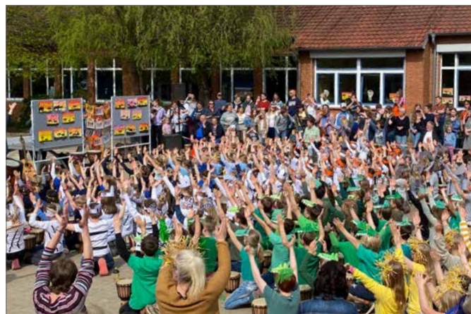
Die Kinder freuen sich über die Aufführung.