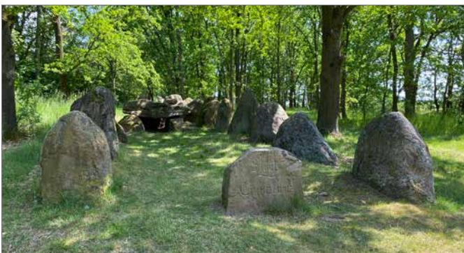
Die Gruppe legt einen Zwischenstopp bei den Königsgräbern bei Haaßel ein, um die jungsteinzeitliche Anlage zu bewundern.