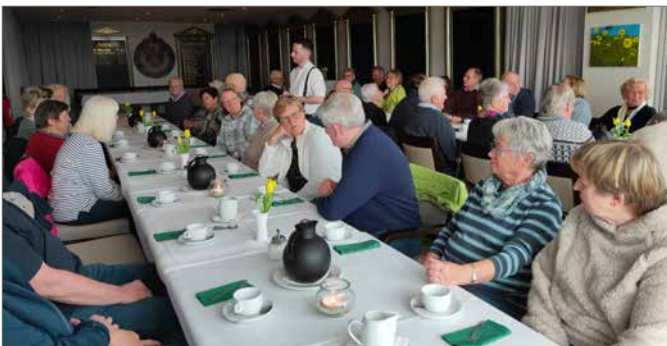
Der letzte Halt: Kaffeetrinken bei der Elbtterrasse Lauenburg. Fotos: privat

Bienenbüttel/Boizenburg/Lauenburg. Die erste Etappe der Bienenbütteler SoVD-Mitglieder auf der Fahrt zum Fliesenmuseum in Boizenburg endete zum Mittagessen in einem Bahnhof in Boizenburg, der keiner mehr ist. Im Jahr 1890 wurde dieser Bahnhof an einer 2,6 Kilometer langen Bahnstrecke für Personen- und Güterverkehr erbaut. 1967 wurde ein Busverkehr eingerichtet und als die schweren Lasten Anfang der neunziger Jahre für den Schiffbau auf der Elbe-Werft nicht mehr benötigt wurden, wurde der Bahnverkehr eingestellt und die Schienen entfernt. Vor dem ehemaligen Bahnhof, jetzt Hotel Stadt Boizenburg, steht sehr malerisch eine bei den Fliesenwerken wiederentdeckte Diesellok, die Zeugnis für die Historie dieses Gebäudes am Boizenburger Hafen gibt.