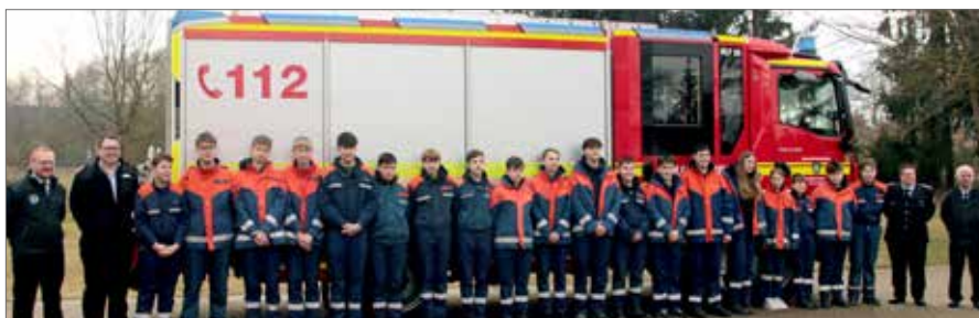
Alle Jugendlichen der teilnehmenden Jugendfeuerwehren der Einheitsgemeinde Bienenbüttel nach der Verleihung des Leistungsabzeichens Jugendflamme 2.

Bei der Brandflohabnahme konnten 9 Kinder aus Bienenbüttel und 10 Kinder aus der Freiwillige Feuerwehr Hohenbostel ihre Auszeichnung entgegennehmen.