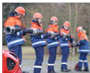
In Fünfergruppen müssen die Teilnehmer sowohl theoretische Fragen als auch praktisches Wissen unter Beweis stellen, z.B. Saugleitung kuppeln und Standrohr setzen.