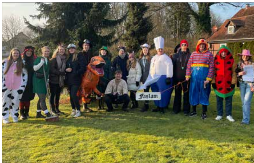
In einfallsreichen bunten Kostümen zogen die Faslambrüder und -schwestern durch den Ort.

Die bunte und fröhliche Stimmung begeisterte alle Beteiligten, die sich bereits darauf freuen, das Faslamssingen auch im nächsten Jahr fortzuführen.