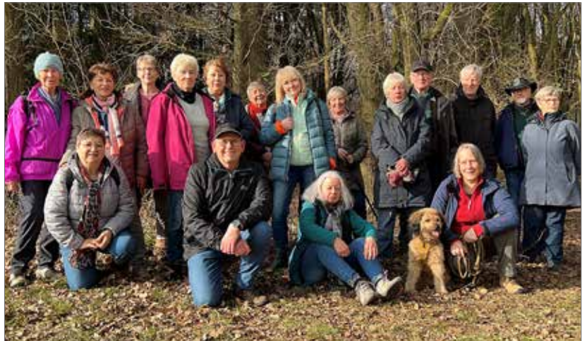
Auf ihrer Februartour legt die Wandergruppe knapp sieben Kilometer zurück.

Unsere Monatswanderung am letzten Februarsonntag lockte bei mildem Spätwinterwetter siebzehn Wanderbegeisterte an die frische Luft und zum Treffpunkt auf dem EDEKA-Parkplatz. Die erste Hälfte der knapp sieben Kilometer langen Route führte uns auf befestigten Straßen über Neu-Steddorf nach Steddorf. Hier bogen wir ab zum Hohenberg. Dort verließen wir die Straße und absolvierten vorwiegend auf Wald- und Feldwegen durch den Steddorfer Bruch und die Weite Welt die zweite Hälfte der Tour zurück bis zum Ausgangspunkt in Bienenbüttel, nachdem am Waldrand in schönster Nachmittagssonne das obligatorische Gruppenfoto entstanden war. In der Weiten Welt entstanden die beiden Aufnahmen von der Bruch-Aue und der von äußerst fleißigen kleinen Helfern durchlüfteten Weidefläche am Wege.