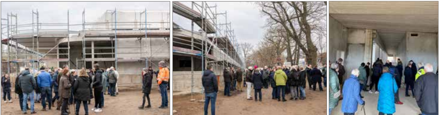
Die ca. 150 Besucher können in kleinen geführten Gruppen sowohl den Innen-, als auch den Außenbereich des Rohbaus erkunden.