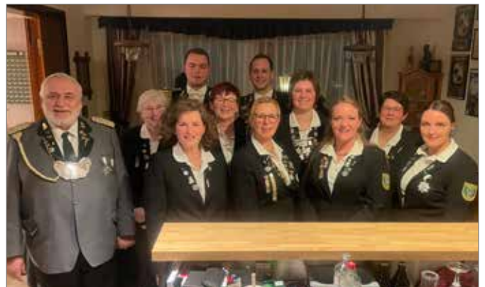
Mitgliederversammlung der Bogensportabteilung in Beverbeck.

Schützengilde seit 1693 e.V. Bienenbüttel und Umgegend