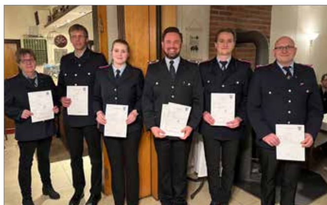
Die Lehrgangabsolventen nehmen ihre Zeugnisse in Empfang.